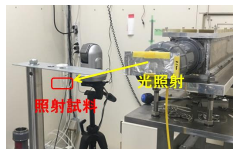
図 1 照射時の様子

これまでに育種した愛知県酵母 FIA1 の尿素非生産性株について、麴エキス培地にて 2 日間培養後、洗浄し、ポリプロピレン製容器に集菌したものを照射試料とした。照射線種は BL8S2 の白色 X 線を利用し、アルミ板(0.2 mm)にて照射強度を調整した。照射試料を図 1 のように設置した。変異処理後、セルレニン含有 YPD 平板培地に塗抹し、30℃で 2 週間培養し、増殖が速く、コロニー径の大きい株（コロニー径が 1.5 mm 以上の株）を一次選抜株として釣菌した。また、照射試料に滅菌水を加えて適宜希釈した後に、YPD 平板培地に塗抹し、30℃で 2 日間培養後、コロニーを計数し、変異処理前の酵母数より酵母の生存率を算出した。変異処理時間は、30 秒、60 秒、300 秒、600 秒間とした。