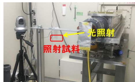
図 1 照射時の様子

前年度に取得した愛知県酵母 FIA1 の尿素非生産性株について、麴エキス培地にて 2 日間培養後、洗浄し、ポリプロピレン製容器に集菌したものを照射試料とした。照射線種は BL8S2 の白色 X 線を利用し、アルミ板(0.5mm)にて照射強度を調整した。照射試料を図 1 のように設置した。変異処理後、セルレニン含有 YPD 平板培地に塗抹し、30℃で 1 週間培養し、増殖が速く、コロニー径の大きい株（コロニー径が 1.5mm 以上の株）を一次選抜株として釣菌した。また、照射試料に滅菌水を加えて適宜希釈した後に、YPD 平板培地に塗抹し、30℃で 2 日間培養後、コロニーを計数し、変異処理前の酵母数より酵母の生存率を算出した。変異処理時間は、10 秒、30 秒、300 秒、600 秒間とした。